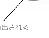
エスプレッソが抽出される コップ