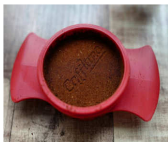
フィルターバスケットの豆を タンピングスcoopで押すと Cafflanoの文字が浮かびます

軽くてコンパクトなエスプレッソメーカー 手動なのに9気圧を維持。 本格的なエスプレッソが簡単に作れます アウトドアはもちろん、軽いのでオフィスにも気軽に持っていきます